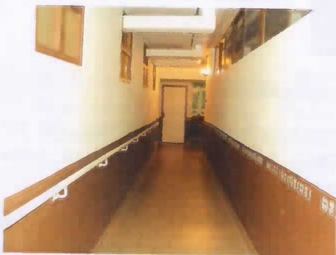
Les couloirs rénovés